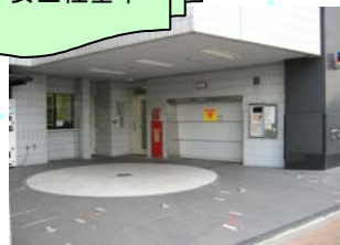
駐車場安全性向上